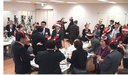
和やかに歓談する参加者

そして、「リピーターのことも考えられており、5年後の自分や半年後の健康に対する配慮もあり、見本となるプラン」という好ましい評価を受けた2人がそれぞれの企画案を説明しました。