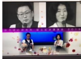
記録ビデオ冒頭画面