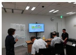
お江戸共想法実施風景

お江戸共想法がスタートしたのは2018年12月、会場は日本橋にある理化学研究所(以下理研)の一室でした。