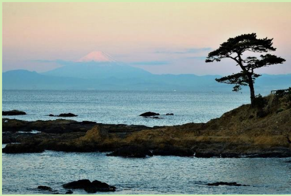
早暁の富士 立石公園(横須賀市)