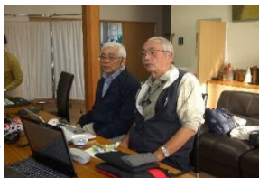
頼もしい2人の“新”スタッフ