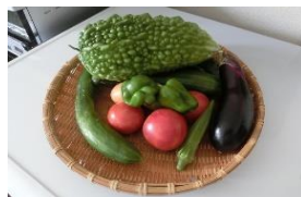
元気の素: 自家栽培野菜