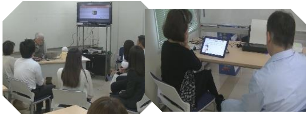
「共想法」体験(左)と物忘れ相談プログラム(右)の体験