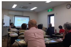
共想法開始前の 所長のためになるミニ講話

継続コースに長く参加している方々に伺うと、「共想法に参加すると、自分と違った発想に気付く、物の見方の面白さに魅力を感じて、早速生活の中に取り入れたりします。共想法のテーマは難しく毎回苦労していますが、お仲間の雰囲気がいいので、大好きです」と答えて下さいました。